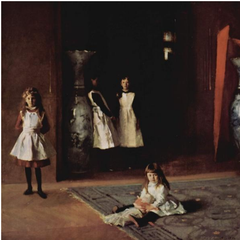
John Singer Sargent